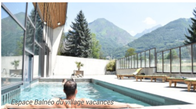
Espace Balnéo du village vacances

Les programmes d'activités sont donnés à titre indicatif et sont susceptibles d'être aménagés selon les conditions météorologiques ou la disponibilité du prestataire. Espace aqualudique couvert et chauffé, n'oubliez pas votre tenue de bain !