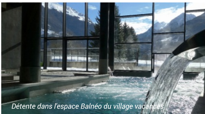
Détente dans l'espace Balnéo du village vacances

Les programmes d'activités sont donnés à titre indicatif et sont susceptibles d'être aménagés selon les conditions météorologiques ou la disponibilité du prestataire. Espace aqualudique couvert et chauffé, n'oubliez pas votre tenue de bain !