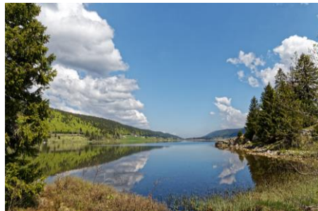
Lac des Rousses

Le contenu des randonnées et les approches kilométriques sont donnés à titre d'exemple. Le contenu est adapté en fonction du niveau des participants, des préconisations des accompagnateurs et des conditions météorologiques.