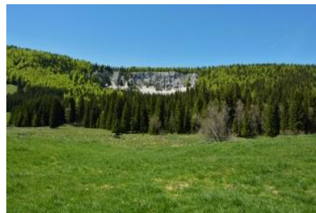
Forêt du Risoux