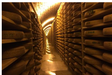
Fort des Rousses